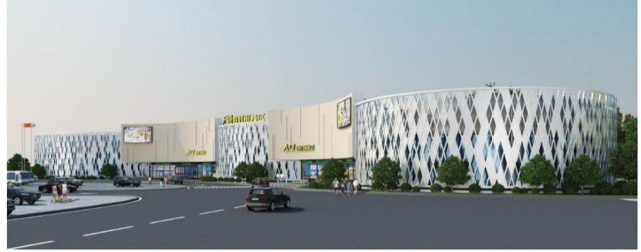
服务区改造效果图

下一步,宁沪公司将继续紧锣密鼓地开展经营转型工作,花大力气推进全新3.0版本服务区建设,确保实现服务区经营全省领先、标杆单位全国领先的既定目标。宁沪公司