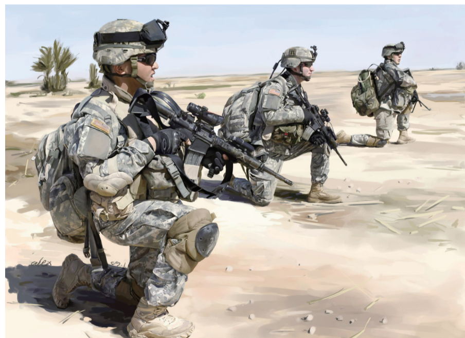
仁士兵（电脑绘画）通行宝公司 尤恺