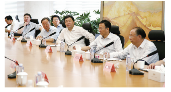
梁永生、保监局局长王新政，以及南京市委常委、常务副市长刘以安等陪同调研。金融租赁公司

省政府副秘书长夏心旻、省金融办主任查斌斌、人民银行南京分行行长郭新明、银监局局长扶拥高、证监局局长