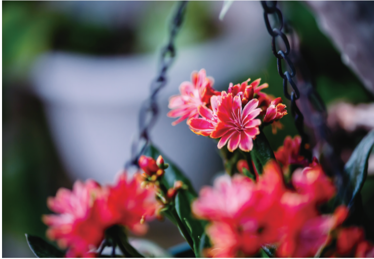
花之韵 京沪公司 吴剑