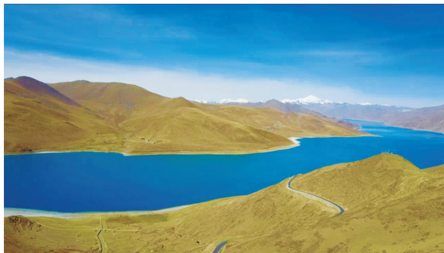
羊卓雍错，佛祖流下的一滴泪 养护公司 陈军