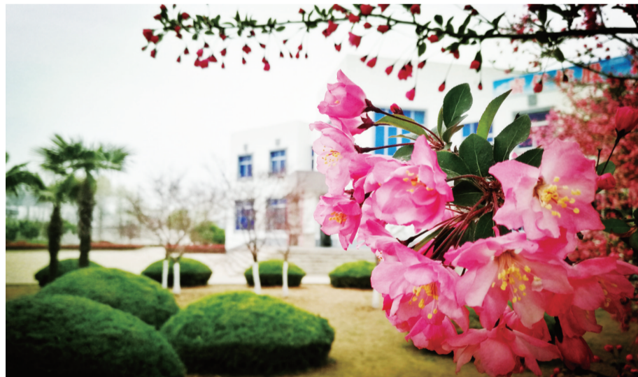
苏鲁春色 京沪公司 陈晓斌