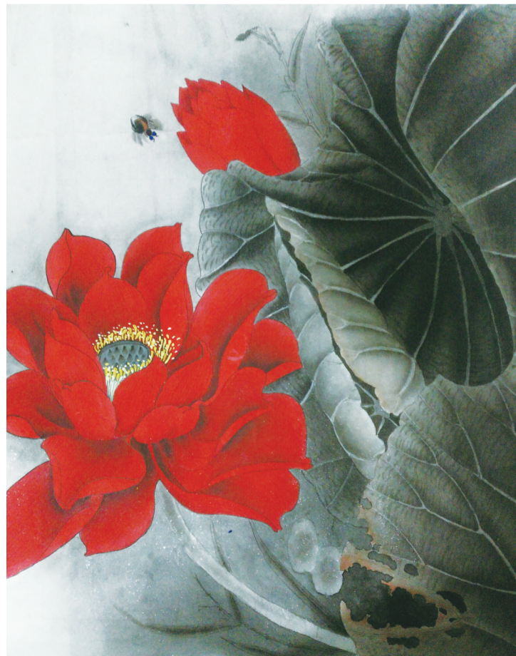
红荷艳阳天 润扬大桥 殷烨琦