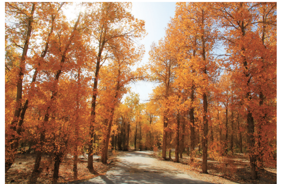
红秋 宁宿徐公司 窦晓勇