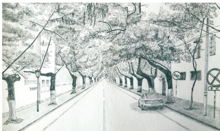
颐和路 金融租赁 靳晓