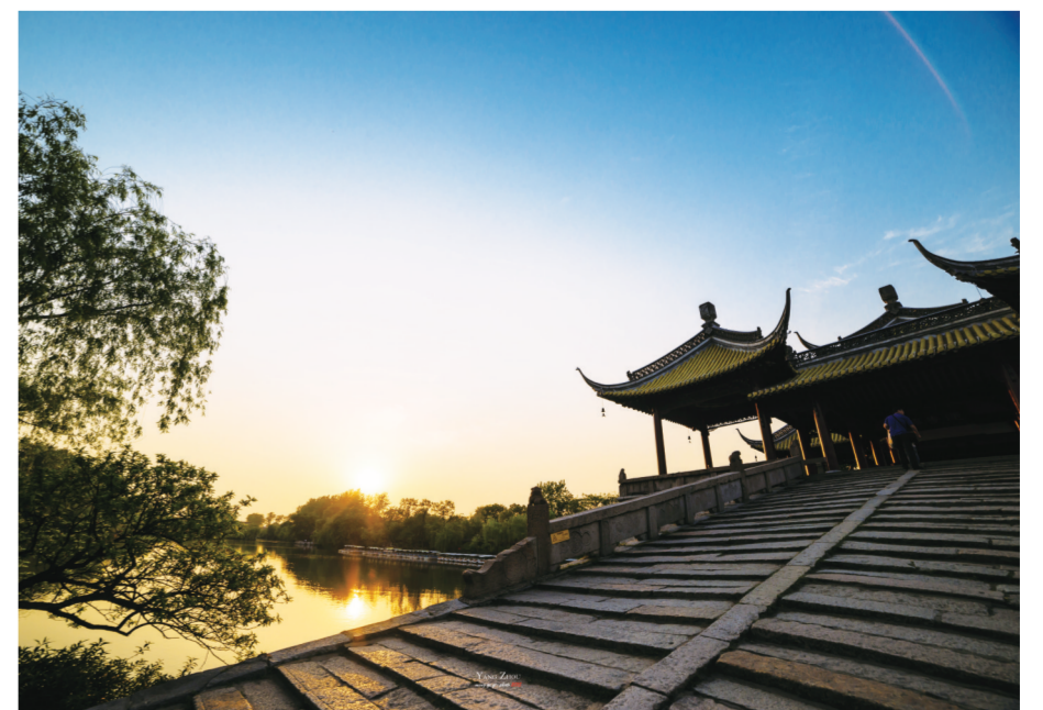
秋日瘦西湖 京沪公司 吴剑